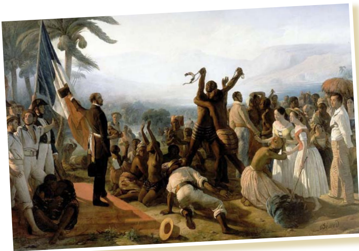
L'Abolition de l'esclavage, 1849, François-Auguste Biard

Aux États-Unis, dès 1787, le statut d'homme libre est progressivement accordé dans les États du Nord. En 1808, le Congrès abolit la traite. En 1861 commence la guerre de Sécession, opposant les États du Nord, presque tous abolitionnistes, et la Confédération des 11 États du Sud esclavagistes qui ont fait sécession. Il y a alors 4 millions d'esclaves noirs aux États-Unis. En 1863, la Proclamation d'émancipation du président Lincoln libère les esclaves résidant dans les États rebelles. En 1865, le 13 e Amendement de la Constitution abolit définitivement l'esclavage sur l'ensemble du territoire.