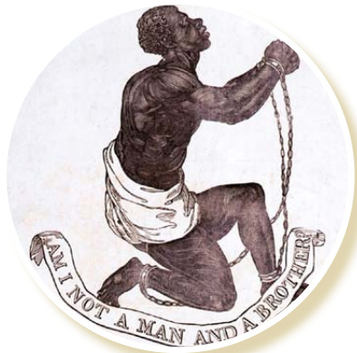
Médaille de la Société abolitionniste britannique, 1795

Au 17 e siècle, dans le but de limiter les abus dans les rapports entre maîtres et esclaves dans les colonies, sans pour autant renoncer à une source d'énormes profits, Français et Anglais réglementent l'esclavage et rédigent des « Codes noirs ». Ce faisant, ils le légitiment.