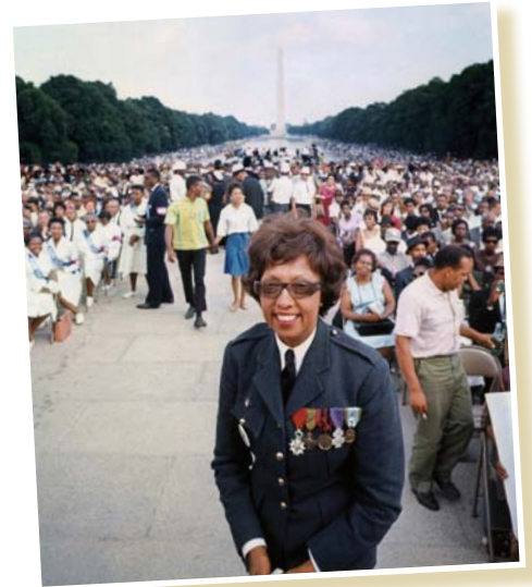
> Lors de la marche des droits civiques de Washington , Joséphine Baker porte son uniforme des Forces françaises libres, sa Légion d'honneur et ses décorations de guerre.

En juin 1963, le président Kennedy déclare que « la race n'a pas de place dans la vie et dans le droit du pays » mais ne parvient pas à obtenir le vote d'une loi. Le 28 août 1963, la Marche sur Washington pour l'emploi et la liberté réunit 200 000 personnes autour de Martin Luther King qui y prononce le célèbre discours « I have a dream ». Joséphine Baker y fait l'éloge de Rosa Parks et Daisy Bates, une journaliste qui a joué un rôle décisif dans la lutte contre la ségrégation dans les écoles.