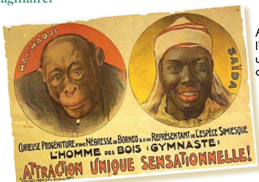
Affiche de l'Exposition universelle de 1931.

Des personnes sont amenées des pays conquis afin d'animer ces décors, en reproduisant les gestes de leur vie quotidienne, en animant des spectacles, notamment de danse, à l'intention des visiteurs curieux d'exotisme. Ce que nous appelons aujourd'hui des zoos humains est né. Au modernisme des Européens « civilisés », on oppose la « sauvagerie » des Africains dont les représentants sont exhibés quasi nus. Des millions de visiteurs se pressent, le succès est considérable et marquera durablement l'imaginaire.