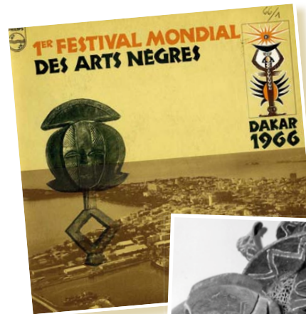
Léopold Sédar Senghor au Festival des arts nègres.

Les années 1960 passent à black , avec le mot d'ordre « Black is beautiful », les années 1980 à Afro-Américain , qui ne comporte plus aucune référence à la couleur de peau. En 2015, Barack Obama rappelle toutefois : « Il ne s'agit pas seulement de ne pas dire 'nègre' en public parce que c'est impoli, ce n'est pas à cela que l'on mesure si le racisme existe toujours ou pas. »