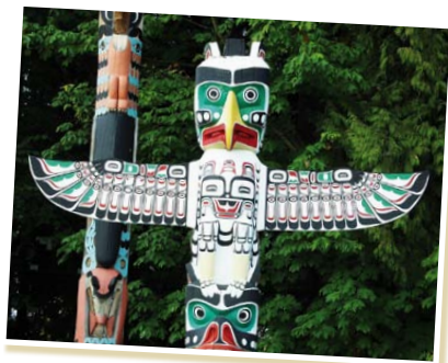
Totem amérindien, ville de Vancouver.