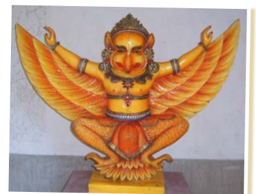
Garuda à Mayapur, Inde.

Chez les hindous, cet aigle géant parfois muni d'une tête d'homme est immortel. Il est la plus puissante des créatures ailées, capable de percevoir ce qui est caché dans notre esprit. Il est la monture du dieu Vishnou, protecteur du monde.