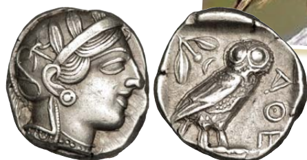
> Tétradrachme athénien représentant Athéna.