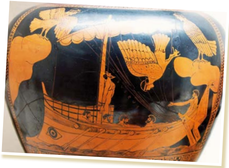
Ulysse et les sirènes, 480-470 av. J.-C.

Dans la mythologie grecque, ces créatures dont le chant attire les marins pour les faire naufrager ne sont pas des femmes à queue de poisson. Ce sont de redoutables oiseaux aux serres puissantes (parfois aux pattes de lion) et à tête de femme.