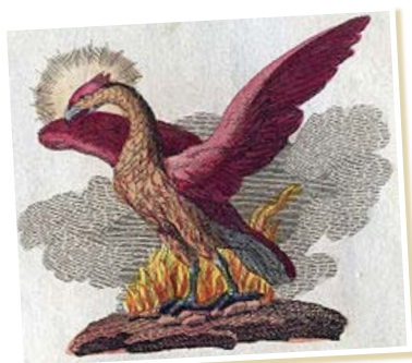
Phénix, gravure, 1790-1830.

D'un mot grec qui signifie « rouge pourpre », le phénix est un grand rapace des mythes égyptiens, grecs et romains. Il est doté d'un pouvoir fabuleux : tous les 500 ans, il met le feu à son nid, s'embrase, et de ses cendres naît un nouveau phénix. Pour les Anciens, il symbolise l'immortalité de l'âme. À ce titre, il est présent dans les premières représentations chrétiennes.