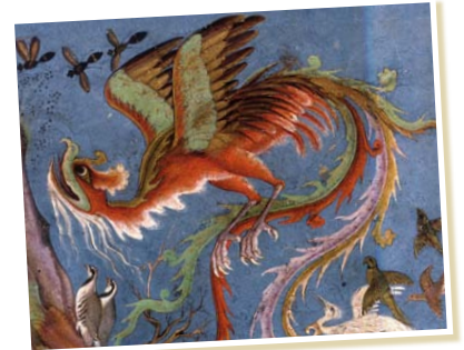
Hippocrate porté au ciel par Simorgh, artiste anonyme, 1177.

En Perse, le simorgh est le roi des oiseaux. Dans les textes les plus anciens, il est décrit comme un faucon au plumage multicolore, ou comme une sorte de paon à tête de femme ou d'animal muni de serres. Comme le phénix, le simorgh symbolise l'immortalité mais aussi la mort du corps matériel et la renaissance spirituelle. C'est pourquoi il est présent dans la tradition religieuse musulmane.