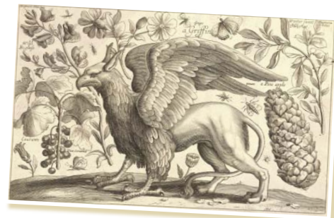
Griffon, gravure Wenceslas Hollar, vers 1650.