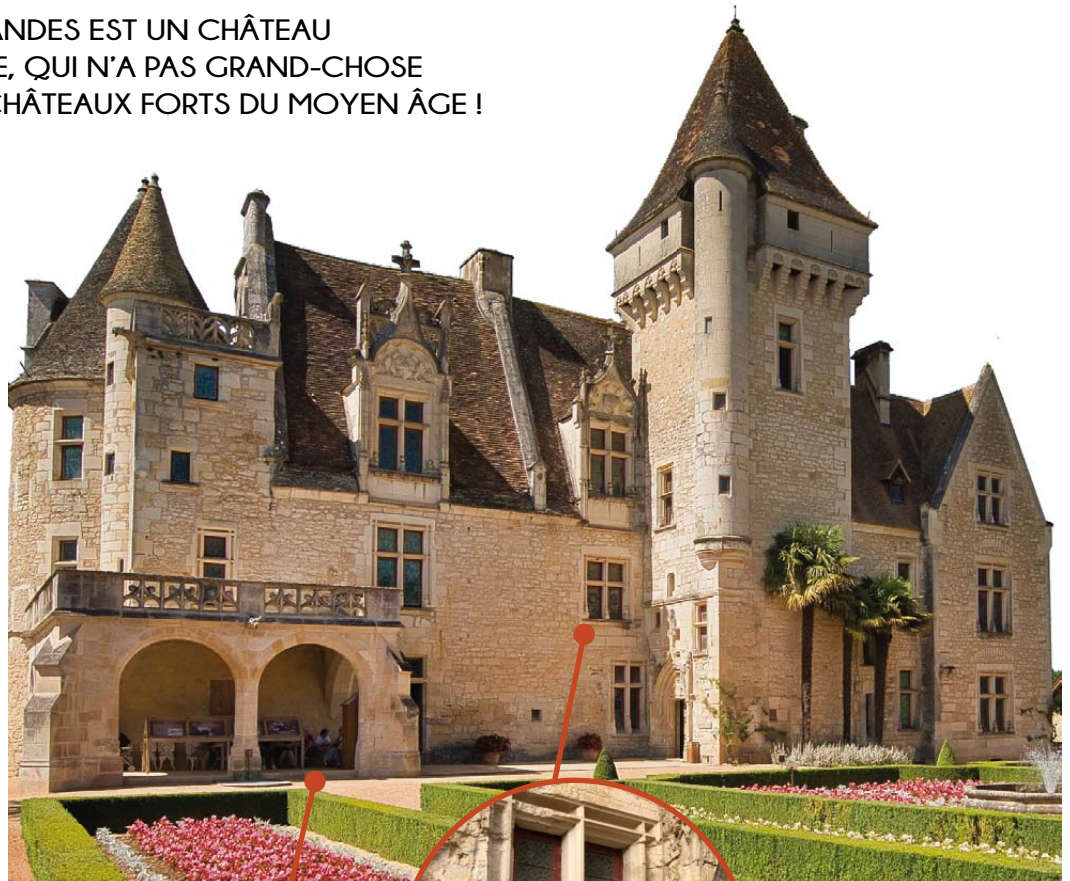
Façade du château des Milanés/

> À l'époque de sa construction, le château possède une galerie d'entrée bordée de cinq arcades.