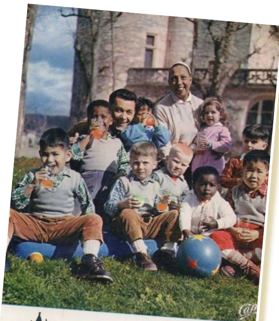
LES MILANDES "Village du Monde"

JOSÉPHINE BAKER rêve d'une grande famille qui remplirait de vie le château des Milandes. Malheureusement, elle ne peut pas avoir d'enfant. Elle décide donc d'en adopter. Convaincue que la race humaine constitue une seule et grande famille, elle choisit d'adopter 12 enfants venus du monde entier. Elle les élève dans le respect de leur religion et de leur culture d'origine. Mais elle souhaite aussi qu'ils s'intègrent dans la vie du village : ils sont donc scolarisés dans les écoles et collèges voisins.