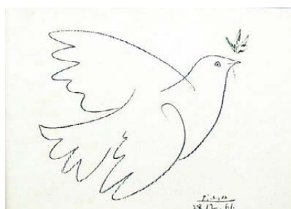
Colombe de la paix, Pablo Picasso, 1961.