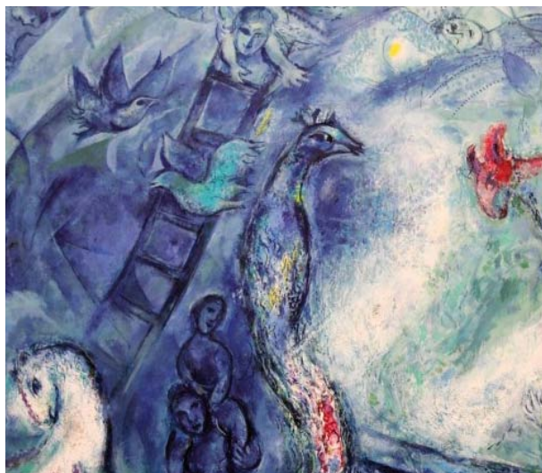
La Colombe de l'Arche , Marc Chagall, 1931-1934.