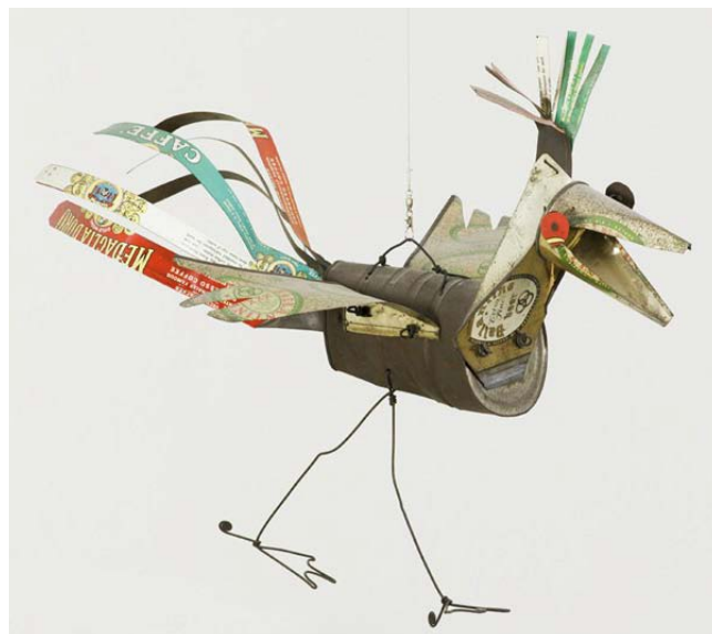
Oiseau, Alexander Calder, 1951.