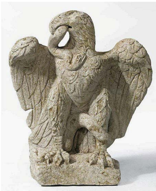
Sculpture romaine d'aigle avalant un serpent, 1 er ou 2 e siècle.