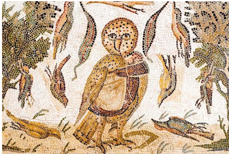
Mosaïque de la chouette, Fin du 3 e siècle.