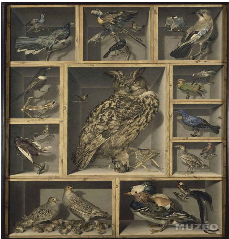
Nature morte aux oiseaux exotiques, Alexandre-Isidore Leroy de Barde, 18 e -19 e siècle.