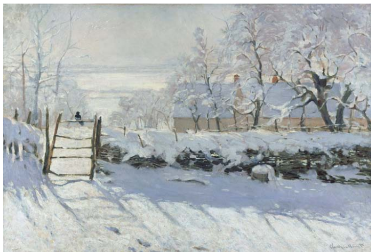
La Pie , Claude Monet, 1868-1869.