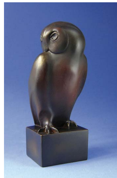
Petite chouette , François Pompon, 1918.