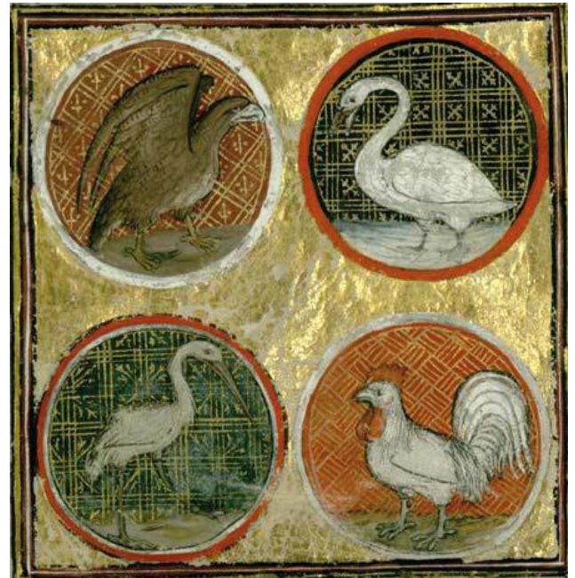
Enluminure de Des propriétés des choses , Barthélemy l'Anglais, 1247.