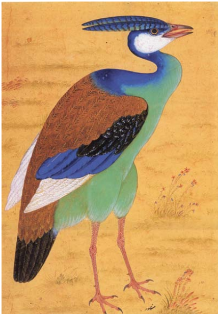
Miniature perse, 1 re moitié du 17 e siècle.