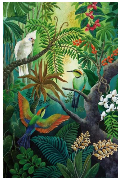
Oiseaux , Henri Rousseau, 20 e siècle.