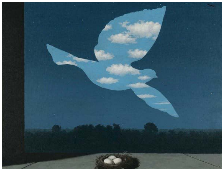
Le Retour, René Magritte, 1940.