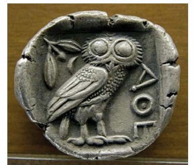
Chouette sur une monnaie d'argent d'Athènes, vers - 480/- 420.