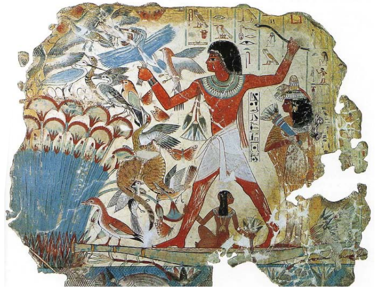
Décor du tombeau de Nebamun, Thèbes, vers - 1350.