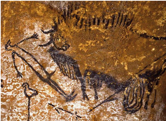
Panneau de l'homme blessé, grotte de Lascaux, Paléolithique : - 20 000/- 12 000 ans.

Les oiseaux sont un thème souvent traité par les artistes, quels que soient leur époque et leur style. En voici quelques exemples célèbres :