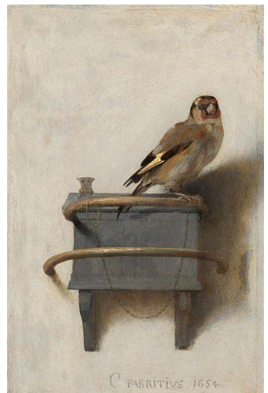
Le Chardonneret , Carel Fabritius, 1654.