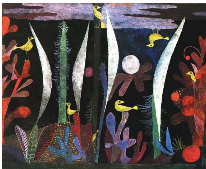
Paysage avec des oiseaux jaunes , Paul Klee, 1923.