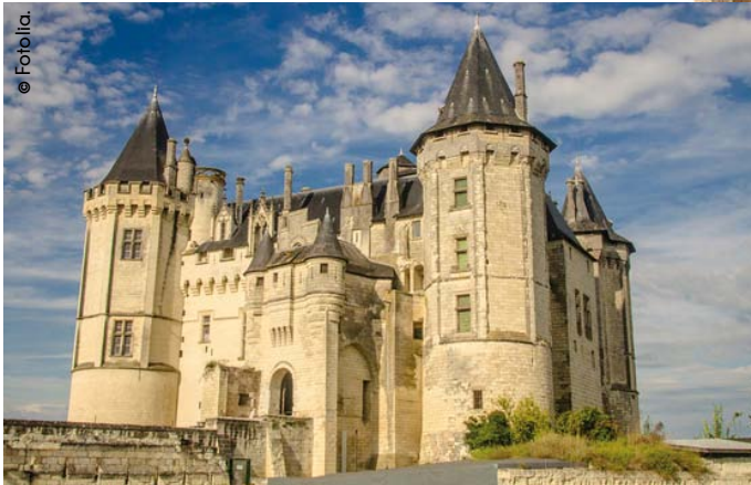
Château de Saumur