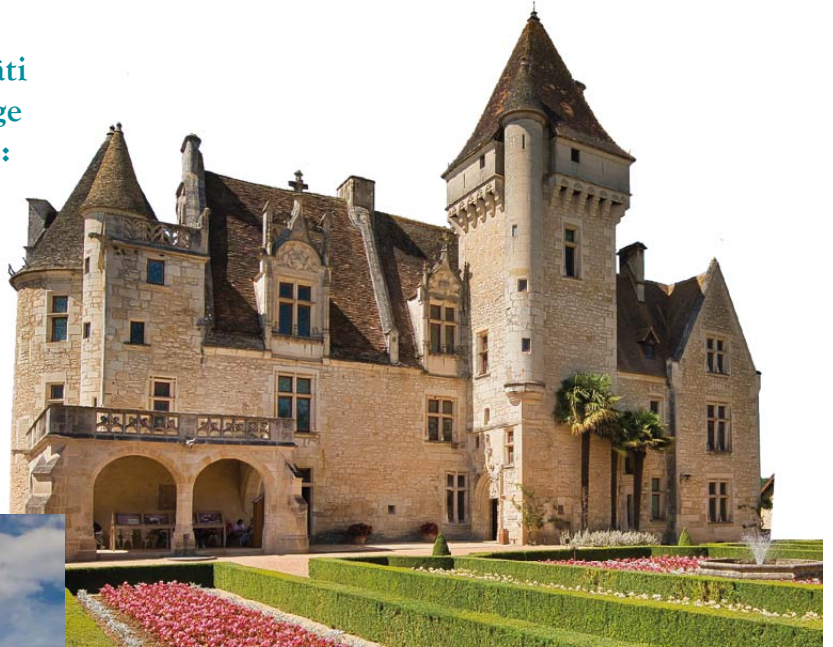
Château des Milandes

LE CHÂTEAU DES MILANDES est bâti à la fin du XV e siècle. Le Moyen Âge touche à sa fin et la paix règne en France : les châteaux forts, conçus pour se défendre, ne sont plus vraiment utiles. Les nouveaux châteaux que l'on construit, comme celui des Milandes, sont donc plutôt des châteaux de plaisance.