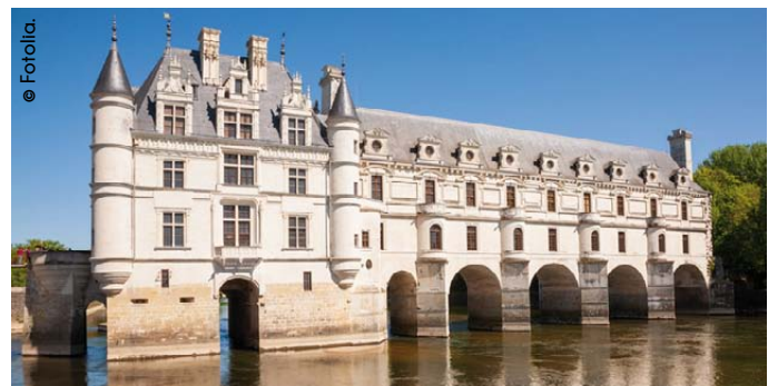
Château de Chenonceau

1 OBSERVE BIEN CES PHOTOS DES MILANDES ET DES CÉLÈBRES CHÂTEAUX DE LA LOIRE. TOUS ONT ÉTÉ CONSTRUITS À LA RENAISSANCE : NE TROUVES-TU PAS QU'ILS ONT DES POINTS COMMUNS ?