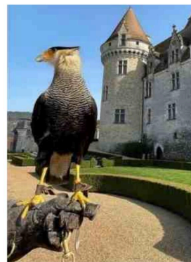
Les faucons, stars des Milandes.

À noter que, samedi et dimanche soir, la brasserie sera ouverte jusqu'à 22 heures. Plus de renseignements sur le site milandes.com.